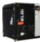
De tornillo rotativo de la serie EN 2,2 - 45 kW / 0,26 - 6,85 m 3 /min