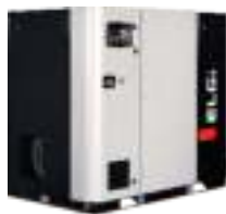
De tornillo rotativo de la serie EG 11 - 250 kW / 1,39 - 43,61 m 3 /min