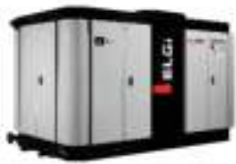
De tornillo exentos de aceite 45 - 450 kW / 5,38 - 73,65 m 3 /min